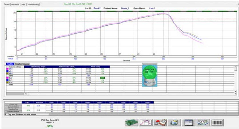
每片PCB板的工艺温度曲线图和数据

更多产品或服务信息请访问我们的网站: www.kicthermal.com or www.kic.cn .